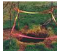
Mouvement de terrain (cavités souterraines)