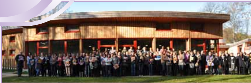
La 3 e journée de professionnalisation des assistantes maternelles au bois du Roule a été une grande réussite