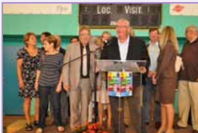
Le forum des associations : le rendez-vous incontournable de la rentrée