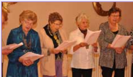
La semaine bleue : entre chant, chorale et loisirs, les seniors étaient à la fête