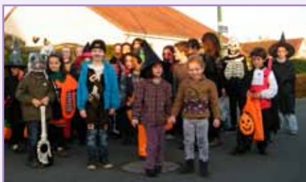
Depuis près de dix ans, une trentaine d'enfants (et de parents) se retrouvent pour fêter ensemble Halloween aux vergers du Roule