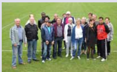
Visite des équipements sportifs avec les Présidents de club et la commission sport