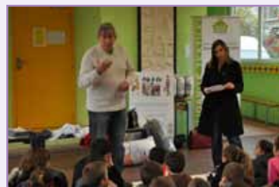
L'association Solidarités textiles est intervenue dans les écoles à l'occasion de la semaine dédiée au tri des déchets