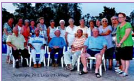
Les seniors se sont rendus en Sardaigne grâce au CCAS de la ville de Darnétal. Douceur de vivre, excursions et bonne table étaient au rendez-vous. Un séjour bien agréable pour tous