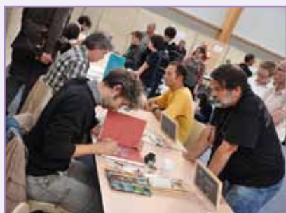
Près de 5000 visiteurs ont bullé au 16 e festival de la bande dessinée Normandiebulle