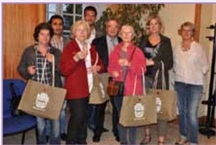
Les nouveaux habitants ont reçu des mains de monsieur le Maire, un cadeau de bienvenue