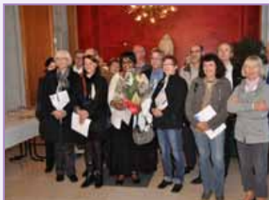
Les remises de médailles du travail sont toujours un moment émouvant