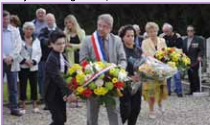
Les commémorations sont des moments citoyens auxquels nos jeunes participent de plus en plus