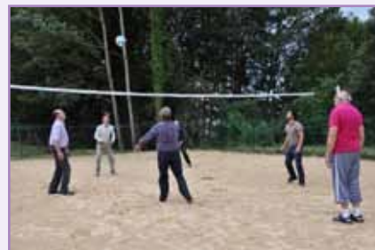
Inauguration du terrain de sable allée de la gare